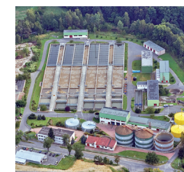
Vodu musíme nejdříve upravit na pitnou, uskladnit ji, a dopravit k odběratelům.